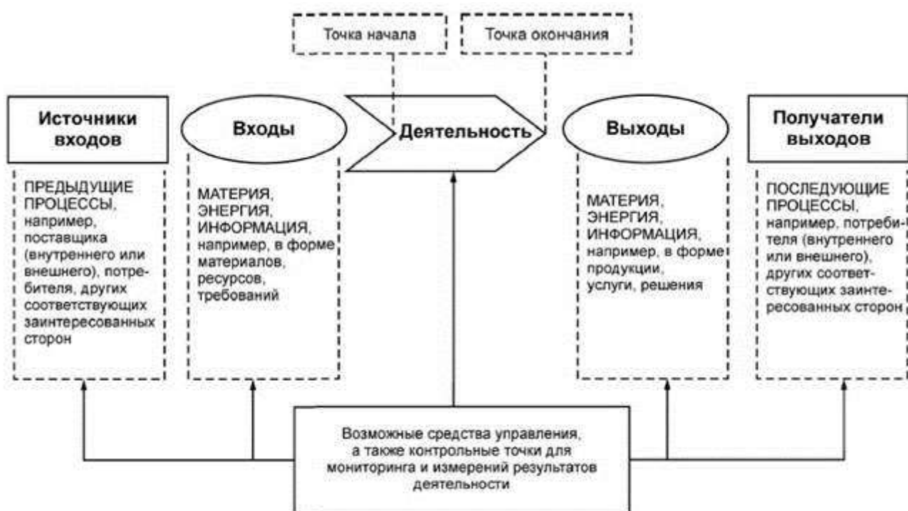
Рис.1 - Схематичное изображение элементов процесса

Рисунок 1 демонстрирует схематическое изображение любого процесса и иллюстрирует взаимосвязь элементов процесса. Контрольные точки мониторинга и измерения, необходимые для управления, являются специфическими для каждого процесса и будут варьироваться в зависимости от соответствующих рисков.